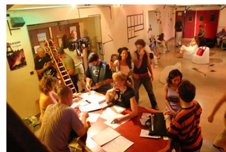
A l'accueil de Micadanses.