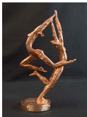
Un trophée réalisé par le sculpteur sourd, Jean Léger.